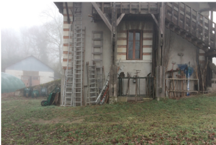
Sky Ladders for Blois, Encre sur papier (manuscrit), impression sur papier, escabeaux en bois et métal, Yoko Ono, 2013. Collection Fondation du Doude